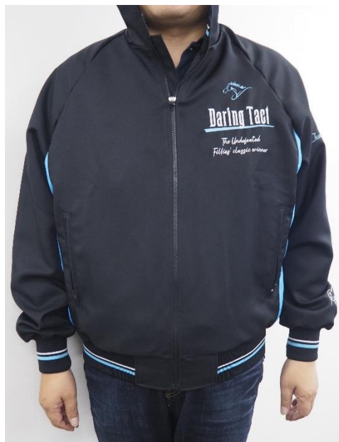
モデル：175cm Lサイズ着用