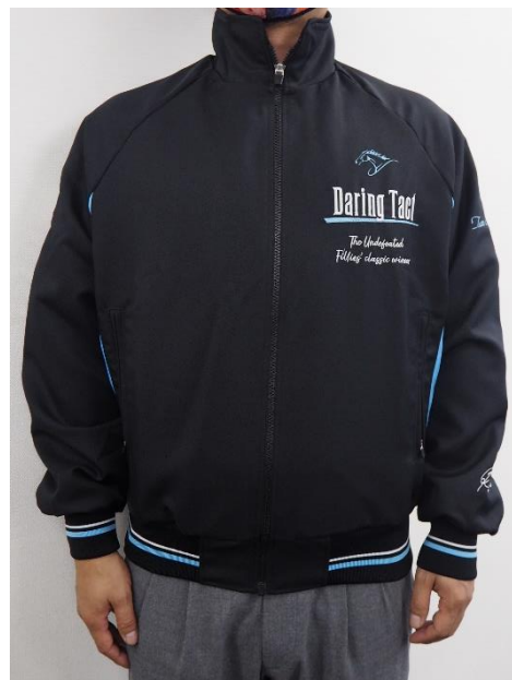
モデル：168cm Mサイズ着用